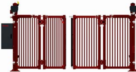
Aluminium – Doppelflügel