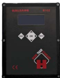
Schaltkasten mit einer Halsang H102 Steuerung und Frequenzmodulatoren