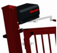
Schneckengetriebemotor mit Zahnkranz.

Die Torpfosten sind aus feuerverzinktem Edelstahl mit RAL-Pulverbeschichtung (gemäß EN ISO 1461), und die Torflügel sind aus Aluminium mit RAL-Pulverbeschichtung. Die Konstruktion ist äußerst stabil, außerdem sind die Tore für das skandinavische Klima optimiert.