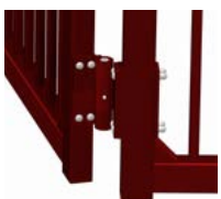
Bearbeitetes Scharnier, belastbar bis 400 kg